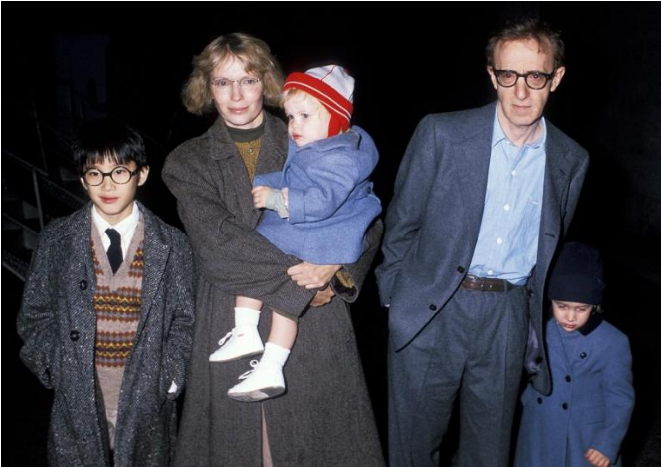
Allen con Moses, Mia, Ronan (in braccio) e Dylan Farrow, intorno al 1987.

dei più accoglienti in quel periodo e che, quindi, sarebbe apparso a chiunque inadatto per commettere un misfatto di quella portata.