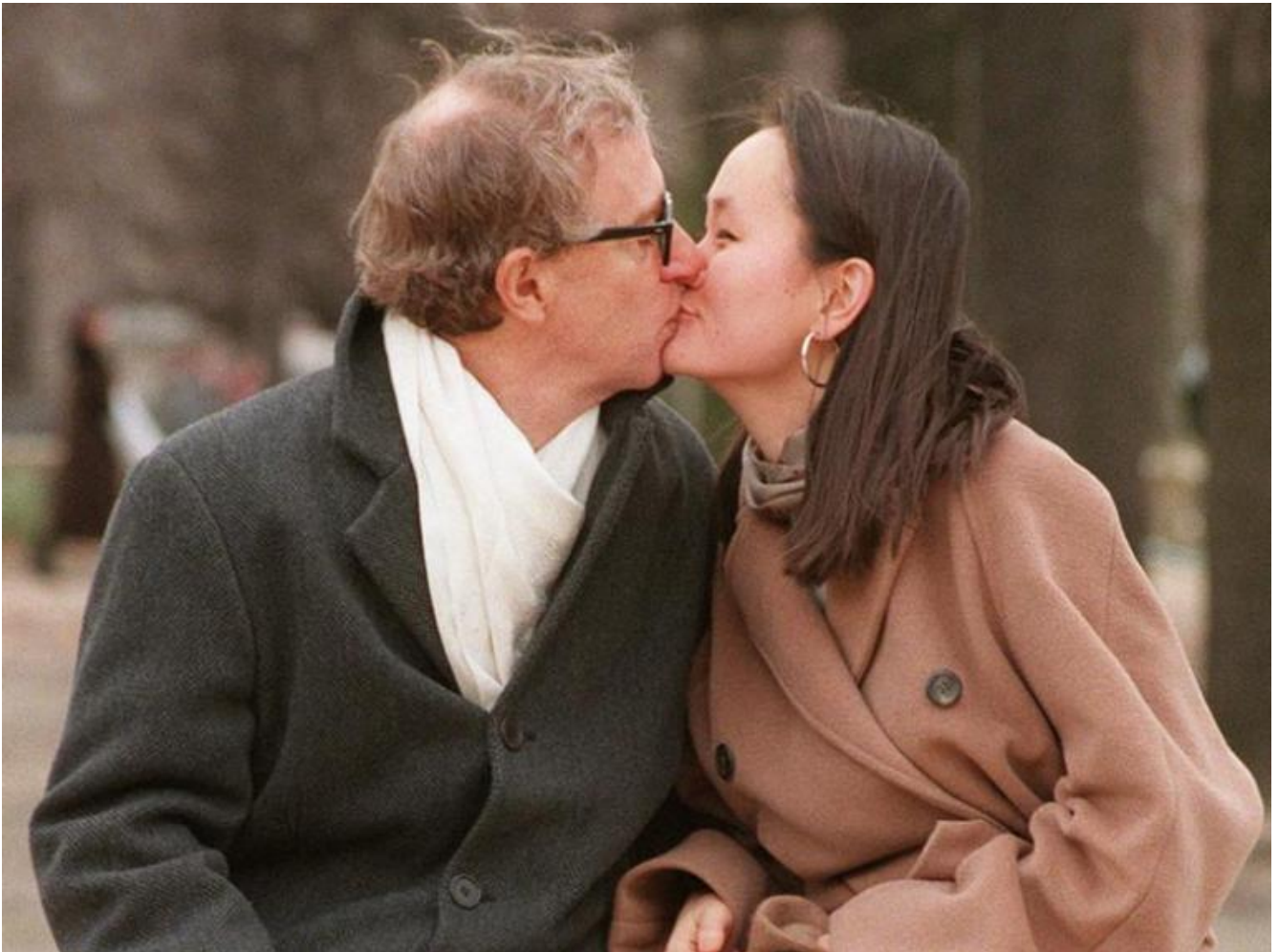
Allen con Soon-Yi Previn, alla fine degli anni '90.

uomini di spettacolo senza scrupoli dichiarino di non voler avere più niente a che fare con lui. Essa è rappresentata dalla fine delle sue peregrinazioni amorose in nome di una ritrovata stabilità emotiva, dalla fedeltà di Soon-Yi, dalla loro felicità di coppia, dalla fine del rocambolesco e dall'avvento di una rassicurante routine, nella vecchiaia.