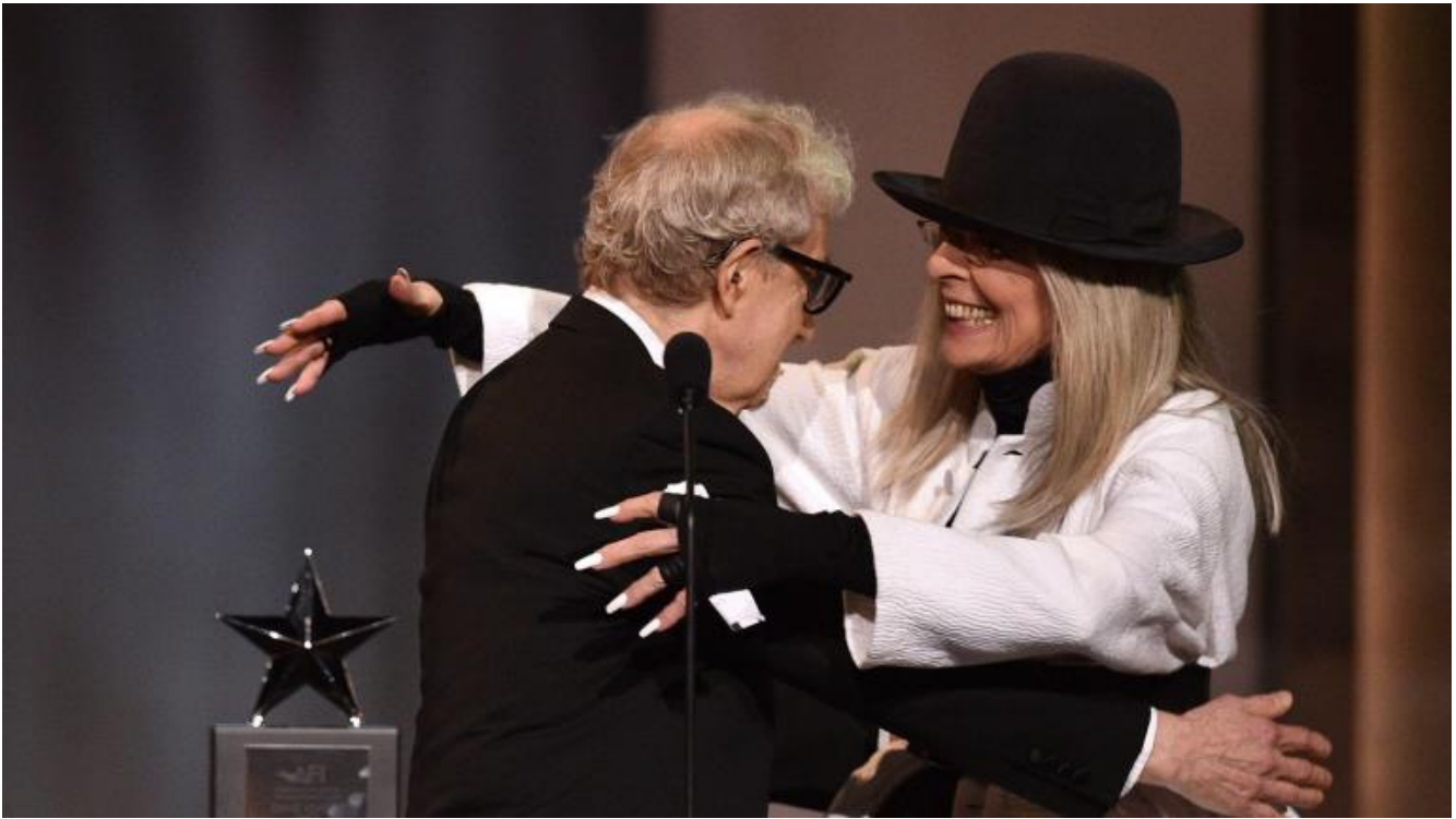
Allen con Diane Keaton nel 2017.